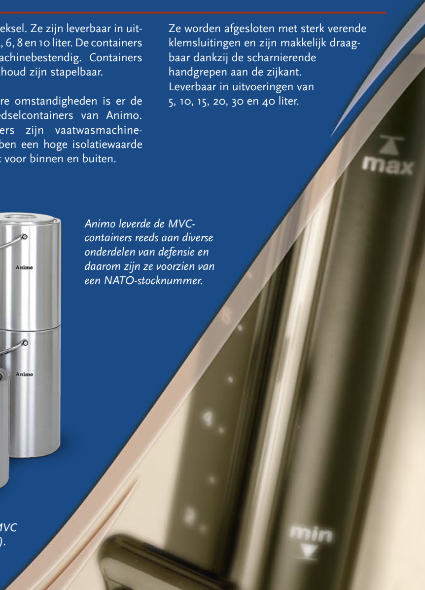
Geïsoleerde voedselcontainers MVC (links) en VC (rechts).

Animo leverde de MVC-containers reeds aan diverse onderdelen van defensie en daarom zijn ze voorzien van een NATO-stocknummer.