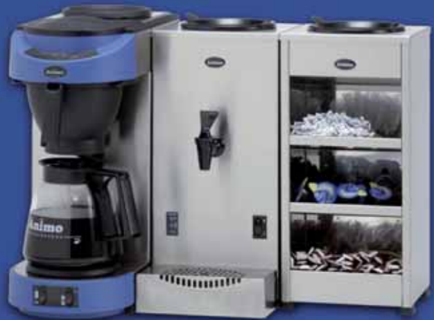
INGREDIËNTENBAK Roestvrij stalen ingrediëntenbak met 3 vakken voor bijvoorbeeld suiker, verpakte melk en lepeltjes