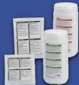
SCHOONMAAKMIDDELEN Voor het ontkalken van M-Line koffiezetapparatuur heeft Animo een speciaal ontkalkingsmiddel en koffieaanslagoplosmiddel