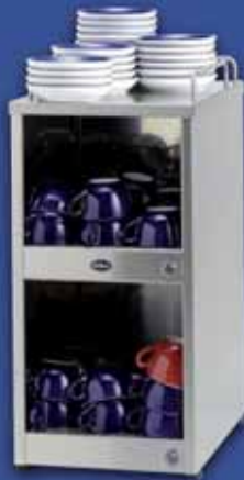
KKWn Koppenwarmer met schotelhouder voor het voorverwarmen van kopjes