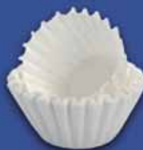
FILTERPAPIER Korffilterpapier 90/250 voor M-Line