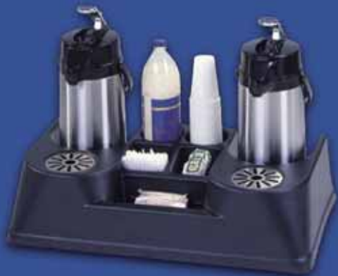
THERMOSKANNENBUFFET Thermoskanbuffet voor twee thermoskannen met lekbak en vijf vakken voor ingrediënten