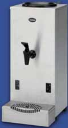
WKT3n Waterkoker met handwatervulling of met vaste wataansluiting

Animo biedt bij de M-Line koffiezetapparatuur de volgende opties en accessoires aan: